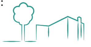
Halles de la Filature