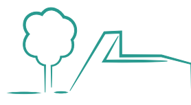
Salle André Wauquier