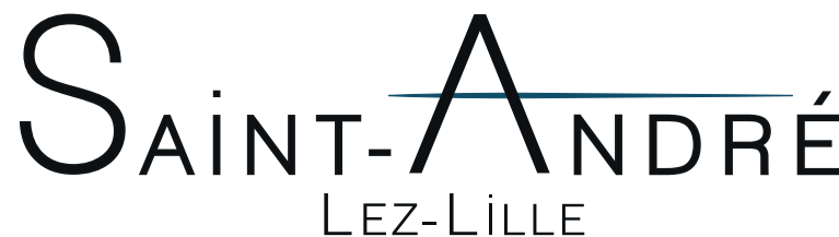
LOGO LIGHT SANS